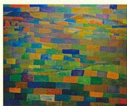
白井拓郎《ユングフラウ》