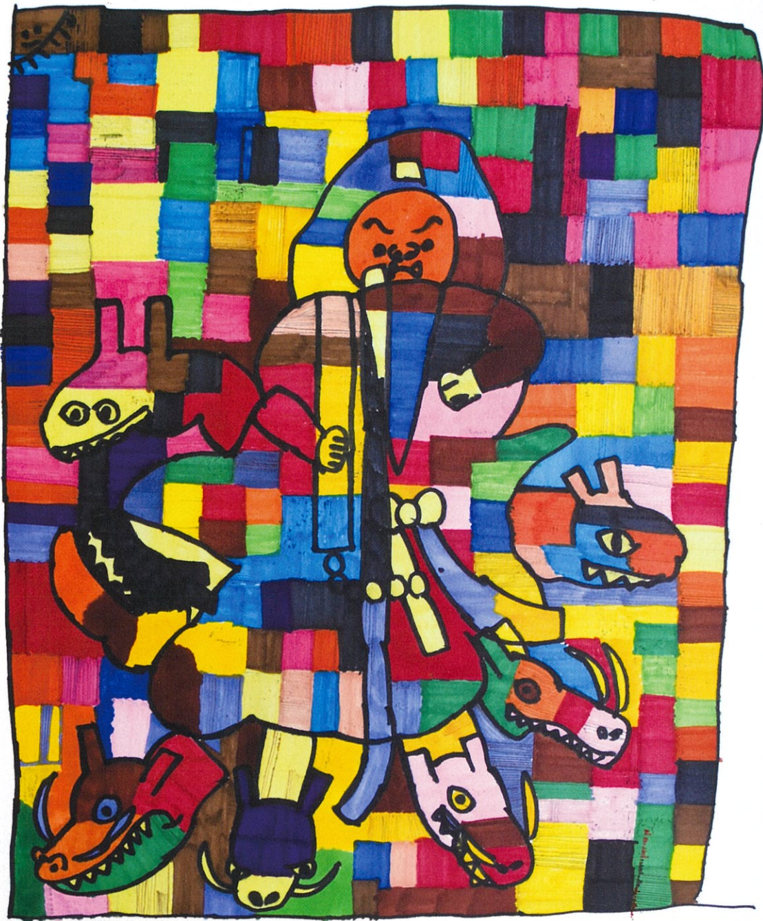
増澤晃《スサノオとヤマタノオロチ》